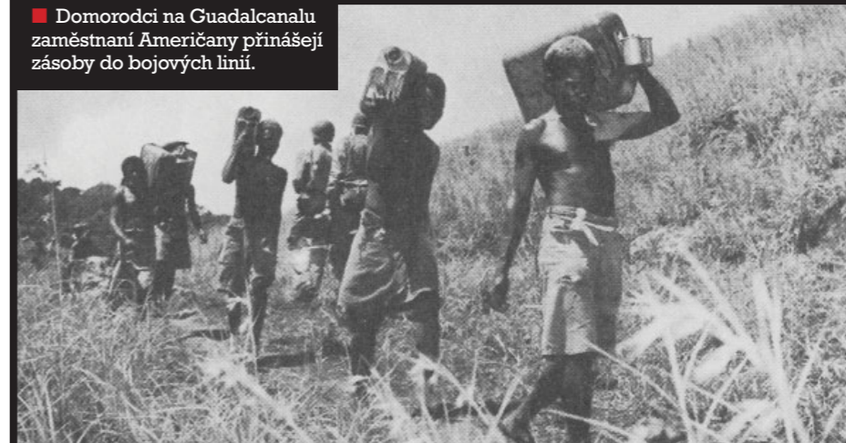
■ Domorodci na Guadalcanalu zaměstnaní Američany přináší zásoby do bojových linií.