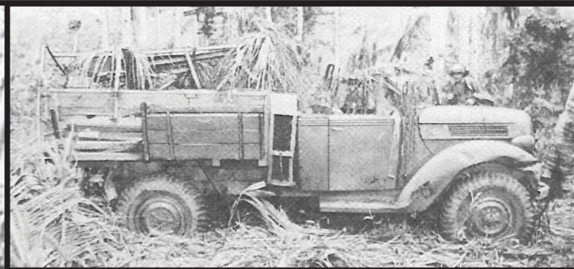
■ (Vlevo) Opuštěný japonský nákladní automobil Isuzu.