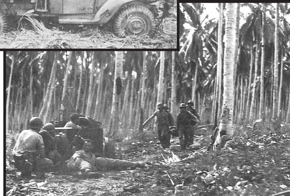
■ Mariňáci při střelbě z houfnice M1A1 ráže 75 mm.